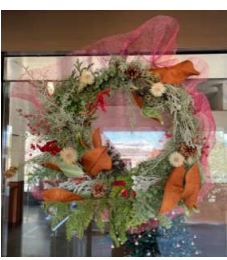
フロントスタッフ作