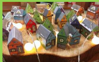
武蔵野ローンテニスクラブ